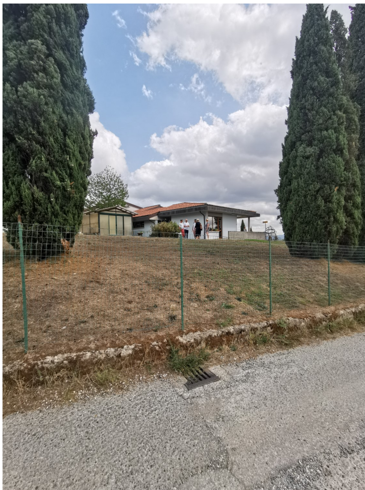
Daginstitution i Pistioa